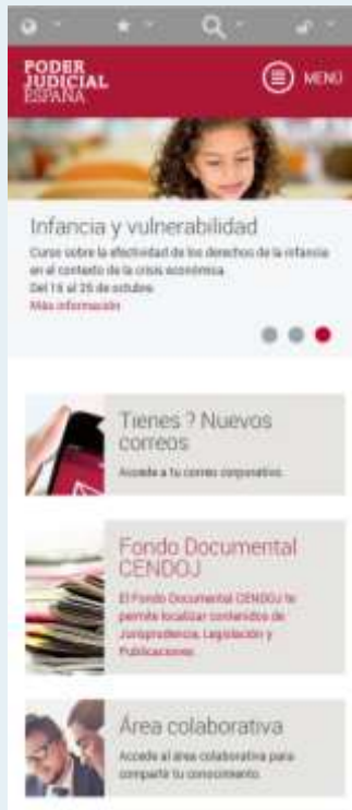
Formato para teléfono móvil

Las opciones personalizadas del usuario que se muestran bajo la pestaña de Área personal se agruparán en el elemento de acceso de la cabecera el cual una vez el usuario se haya identificado contendrá opciones como Mi Perfil, Mis Comunidades, Mis Aplicaciones o el acceso al correo y al Área personal