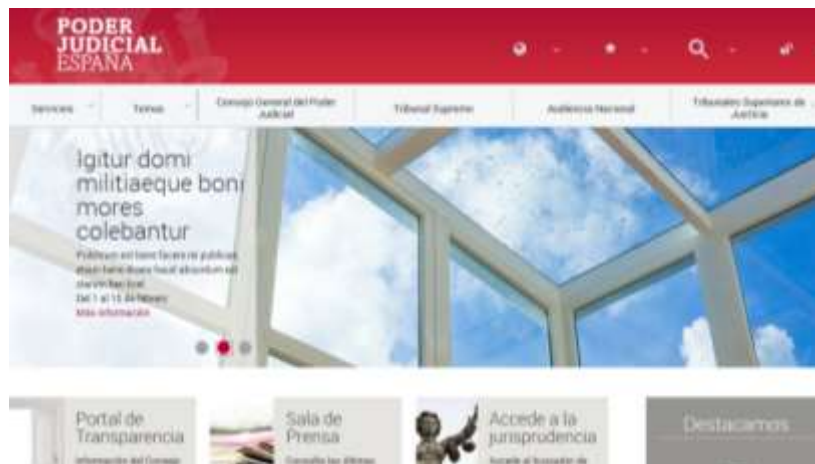
Formato para tablet

El nuevo diseño del portal es un diseño adaptativo, que se adecua a los diferentes dispositivos desde los cuales se visualiza, pantallas, móviles, tabletas. Redimensiona el contenidos al ancho de la pantalla del dispositivo, reordenando y ocultando, a veces, los elementos que forman la página, para conseguir una presentación clara y usable..