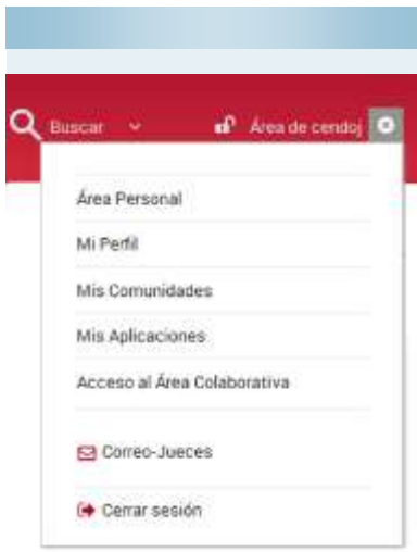
Menú del elemento de acceso de identificación.